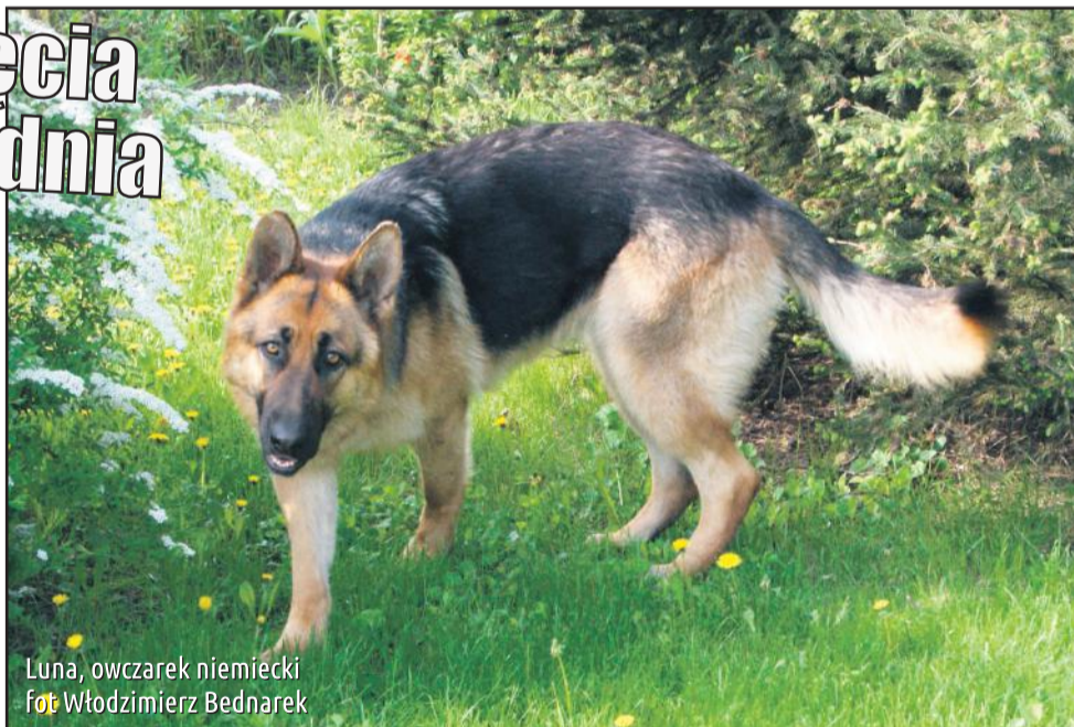
Luna, owczarek niemiecki