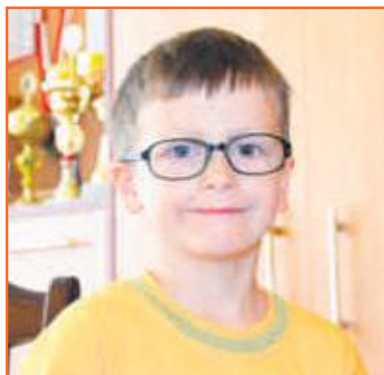
Damian Przedszkole Słoneczny Zakątek w Ostrzeszowie

Szczęście jest wtedy, kiedy przeżywamy radosne chwile i kiedy dostaję nową zabawkę. Pierwsza komunia, urodziny i spędzanie czasu z rodziną, to również wielkie szczęście.