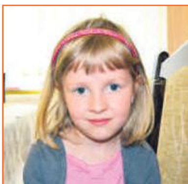
Oliwia Przedszkole Słoneczny Zakątek w Ostrzeszowie

Szczęściem jest to, że moja mama ma takie fajne dzieci oraz to, że ja mam fajnych rodziców. Lubię też dostawać nowe zabawki i wtedy też jestem szczęśliwa.