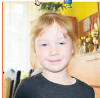
Ania Przedszkole Słoneczny Zakątek w Ostrzeszowie

Szczęście jest wtedy, kiedy ma się bardzo dużo pieniędzy i można coś kupić. Kiedy dostaję nowe zabawki i prezenty, wtedy również jestem szczęśliwy.