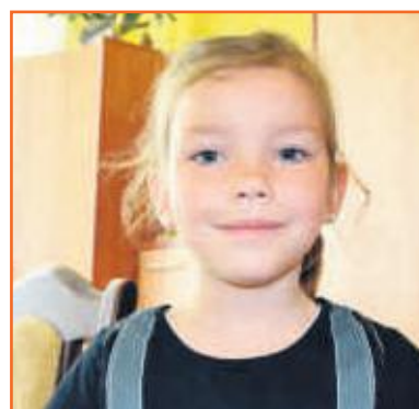
Nadia Przedszkole Słoneczny Zakątek w Ostrzeszowie

Szczęście jest wtedy, kiedy ma się dużo złota, dostaje się prezenty i spędza się czas z rodziną na spacerach i wyjazdach.