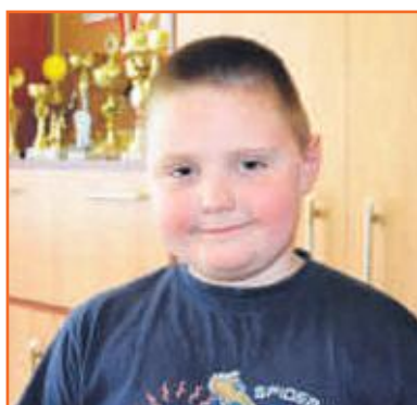
Kacper Przedszkole Słoneczny Zakątek w Ostrzeszowie

Szczęście jest wtedy, kiedy dostajemy coś nowego oraz wtedy, kiedy spędzamy czas z rodziną i wychodzimy razem na spacer.