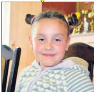
Julia Przedszkole Słoneczny Zakątek w Ostrzeszowie

Szczęście jest wtedy, kiedy przeżywamy radosne chwile i kiedy dostaję nową zabawkę. Pierwsza komunia, urodziny i spędzanie czasu z rodziną, to również wielkie szczęście.