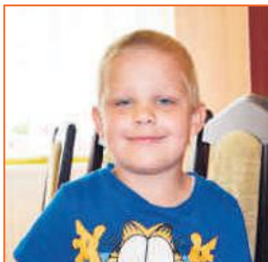
Mikołaj Przedszkole Słoneczny Zakątek w Ostrzeszowie

Szczęście jest wtedy, kiedy ktoś znajduje skarb, złote pieniądze i mapę do skarbu. Wielkim szczęściem jest to, że mamy rodziców i dziadków.