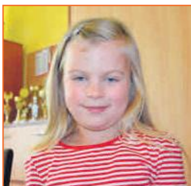
Marta Przedszkole Słoneczny Zakątek w Ostrzeszowie

Szczęście jest wtedy, kiedy moja babcia może mi kupić nową zabawkę, a mama hot wheelsa na klucz. Również wtedy, kiedy spędzamy razem czas.