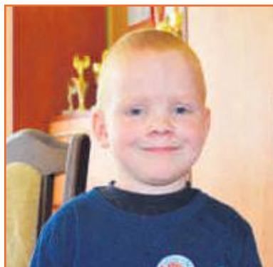
Oskar Przedszkole Słoneczny Zakątek w Ostrzeszowie

Szczęściem jest nasza rodzina, kiedy wszyscy razem wyjeżdżamy i spędzamy wspólnie dużo czasu. Jak dostaję nowe rzeczy i prezenty, to też jest fajnie.