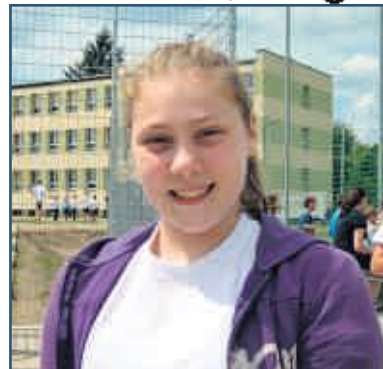
Ola uczennica I klasy gimnazjum

Kiedy osiągamy swój cel, np. wtedy, kiedy zdobywamy dobre oceny w szkole lub wysokie wyniki w osiągnięciach sportowych. Jestem szczęśliwa, kiedy moi bliscy osiągają swoje cele i spełniają swoje marzenia, mogę wtedy z nimi dzielić radość.