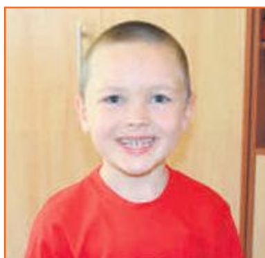
Franek Przedszkole Słoneczny Zakątek w Ostrzeszowie

Szczęściem jest spędzanie czasu z rodziną, wspólne wyjazdy i kiedy dostaję się prezent i nową zabawkę. Również szczęście innych jest szczęściem dla nas.