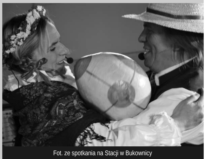
Fot. ze spotkania na Stacji w Bukownicy