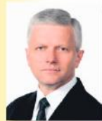
Andrzej Grzyb Poseł do Parlamentu Europejskiego Prezes ZW PSL w Wielkopolsce