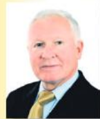
Józef Racki Poseł na Sejm RP