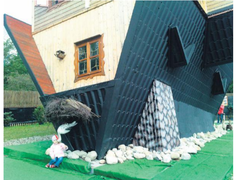
Domek do góry nogami w Zakopanem

Jeżeli zauważyłeś coś ciekawego, zrób zdjęcie i wyślij je na redakcja@naszestrony.info.pl z dopiskiem "Zdjęcie tygodnia", a zamieścimy je na łamach gazety!