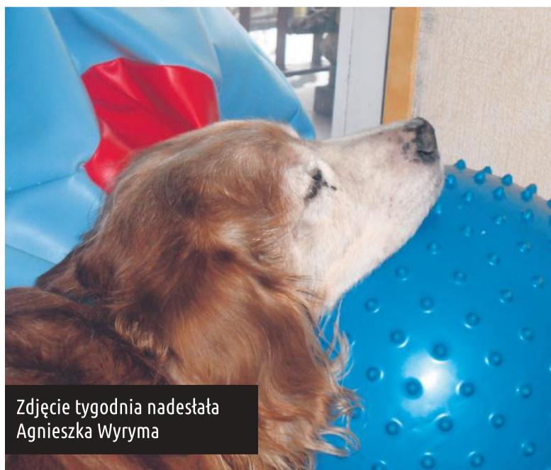
Zdjęcie tygodnia nadesłała Agnieszka Wyrzyna