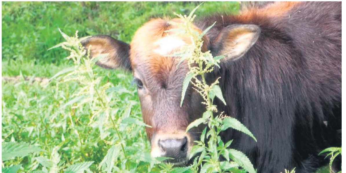
Nadesłane przez Cicho-Sza