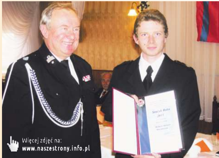
Więcej zdjęć na: www.naszestrony.info.pl