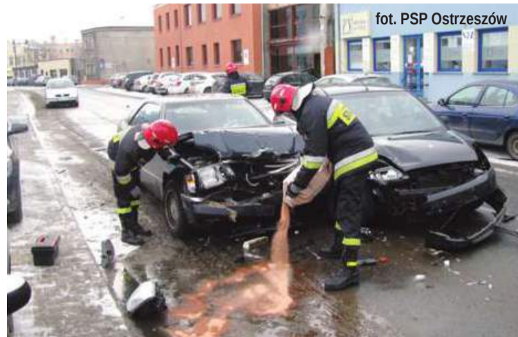
fol. PSP Ostrzeszów

5 1-letnia mieszkanka gm. Ostrzeszów kierująca fordem podczas skrętu w lewo nie ustąpiła pierwszeństwa przejazdu, czym doprowadziła do zderzenia z jadącym z naprzeciwka mercedesem.