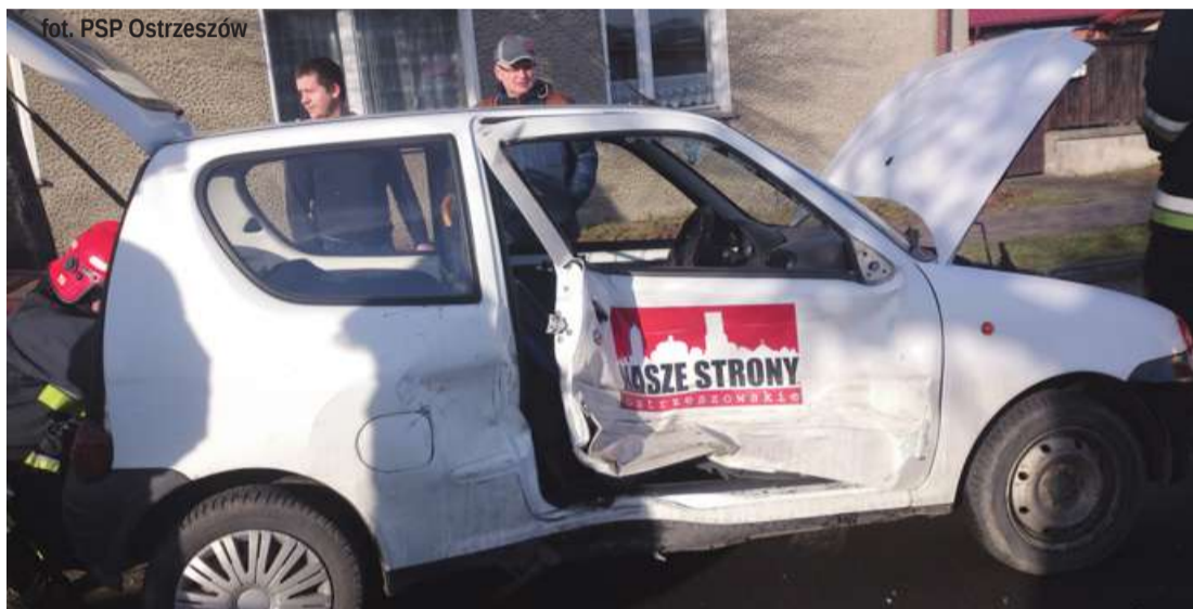
fol. PSP Ostrzeszów

Poniedziałkowy dzień na długo pozostanie w naszej pamięci. Wszystko za sprawą zdarzeń drogowych mających miejsce na terenie miasta i poza nim, również tych tragicznych. Kolizja drogowa nie ominęła niestety „Naszych Stron”.