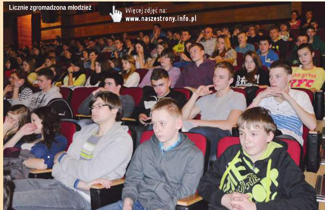
Liczenie zgromadzona młodzież

Więcej zdjęć na: www.naszestrony.info.pl