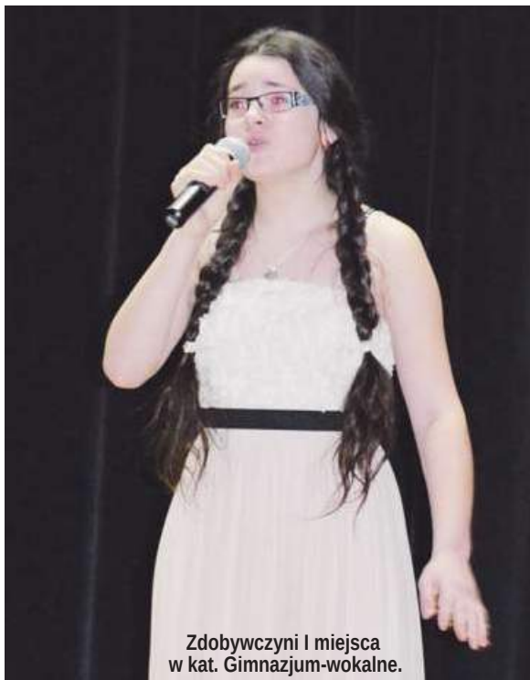
Zdobywczyni I miejsca w kat. Gimnazjum-wokalne.