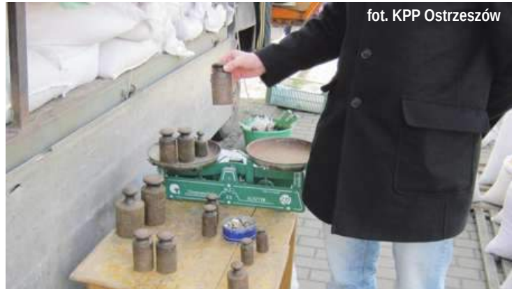
fol. KPP Ostrzeszów

A jakie są wyniki przeprowadzonych działań? - Wylegitymowano łącznie 16 osób w tym 8 obcokrajowców, wszyscy na terenie RP przebywali legalnie. Przeprowadzono 33 kontrole punktów sprzedaży towarem. Pracownicy Obwodowego Urzędu Miar w wyniku kontroli ujawnili 2 przypadki braku prawnej kontroli metrologicznej, wobec tych osób zastosowali postępowanie mandatowe. Funkcjonariusze Straży