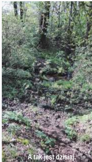
A tak jest dzisiaj.

Angażując w opracowanie projektu i późniejszą opiekę nad źródłem klasy kształcącej techników architektury krajobrazu i techników turystyki wiejskiej Zespołu Szkół nr 2, można w to włączyć młodzież. Będzie z tego podwójna korzyść, bo teren zyska na atrakcyjności, a uczniowie mając więcej praktyki, będą później lepszymi fachowcami.