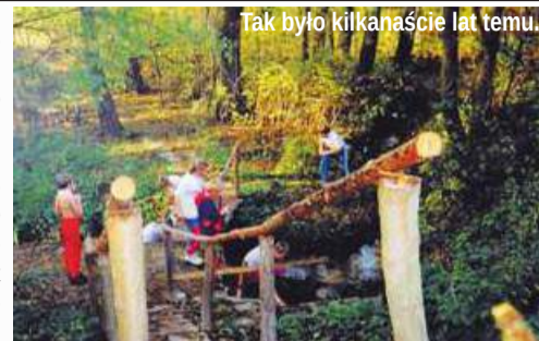
Tak było kilkanaście lat temu.

Nie jest już tajemnicą, że powiat ostrzeszowski osiągnął pierwsze miejsce w Wielkopolsce i dwunaste w kraju pod względem umieralności z powodu chorób układu krążenia. Starosta wreszcie zaczął mówić o potrzebie profilaktyki poprzez upowszechnianie zdrowego stylu życia, więc jest nadzieja, że zacznie coś robić. Może również dzięki środkom z Funduszy Norweskich w ramach Programu „Ograniczanie społecznych nierówności w zdrowiu”, o które powiat zabiega, ścieżka do „Głodnego Źródła” zostanie szybciej wybudowana.