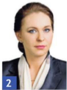
2 MOŻDŻANOWSKA ANDŻELIKA

Posel do Parlamentu Europejskiego, Prezes PSL w Wielkopolsce, Członek Rady Fundacji Solidarności Międzynarodowej, Powiat Ostrzeszowski