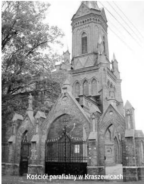
Kościół parafialny w Kraszewicach

Najstarsza wiadomość o Kraszewicach pochodzi z XIII w. W 1431 r. Kraszewice była zarejestrowana jako wieś królewska należąca do starostwa grabowskiego oraz Ziemi Wieluńskiej. W okresie od XVI do XVIII w. rozwijało się bartnictwo, wyrób piwa i spirytusu. Od pierwszej połowy XV w. do początku XIX w. istniała tutaj huta żelaza wytapianego z rudy darniowej. W 1423 r. w Kraszewicach miał miejsce przywilej fundacyjny Kuźnicy wystawiony przez Władysława Jagiełłę w Lewoczy. W 1641 r. nastąpiła fundacja Kościoła w Kraszewicach. W 1649 r. król Jan Kazimierz oddał starostwo grabowskie, a więc i Kraszewice Janowi Kazimierzowi Krasińskiemu. W 1655 r. dekret króla Jana Kazimierza określa liczbę mieszkańców na 617 osób. W roku 1736 i 1737 na ziemi wieluńskiej panował wielki głód, który dotknął także mieszkańców Kraszewic. Przywilejem Augusta III Sasa z dnia 17 lipca 1754 r. w Kraszewicach powstało samodzielne wójtostwo mające własny folwark, a także browar, młyn i karczma. Pod koniec XVII w. wieś została oczyszczona. Dwukrotnie doszło tu do wybuchu buntu chłopów - pierwszego w 1761 r., a drugiego w 1789 r., na którego czele