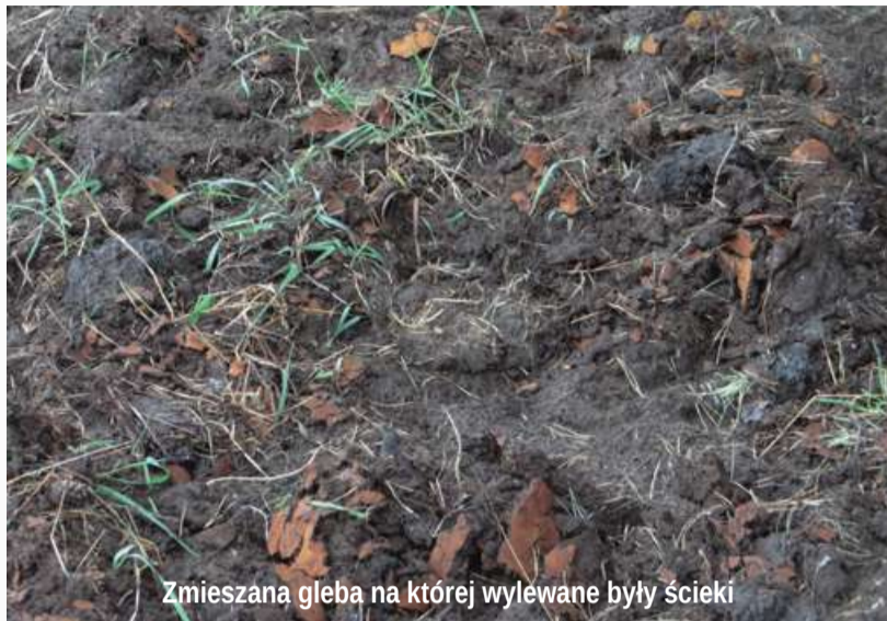
Zmieszana gleba na której wylewane były ścieki