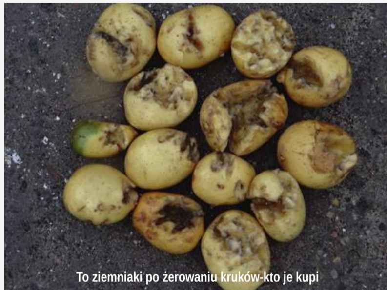
To ziemniaki po żerowaniu kruków- kto je kupi

zapachy. Rozchodzący się po okolicy odór psujących się fragmentów skóry, która podczas skubania drobiu może trafić do zbiorników wraz z piórami, stał się pokusą dla kruków. Chociaż siatka okalająca magazyn jest porozrywana, to gromadnie przybywające w to miejsce kruki, nie mogąc zaspokoić głodu, wydziobują z okolicznych upraw nasiona, przez co zostały przerzedzone pola kukurydzy, a w jej miejscu rośnie teraz dzikie proso. Ostatnio łupem ptaków stała się