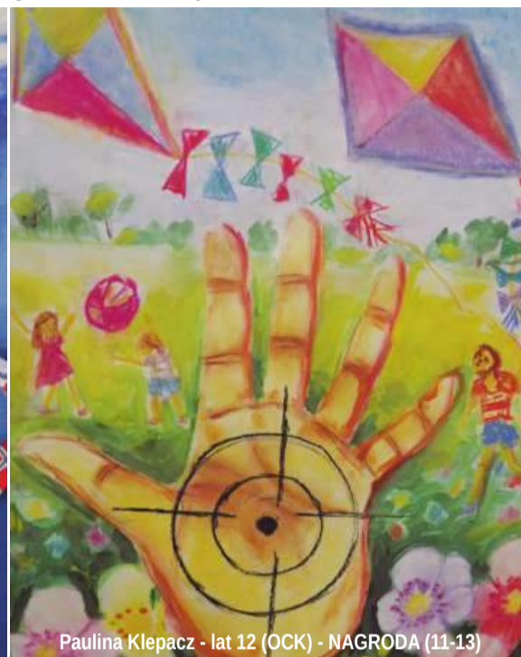
Paulina Klepacz - lat 12 (OCK) - NAGRODA (11-13)