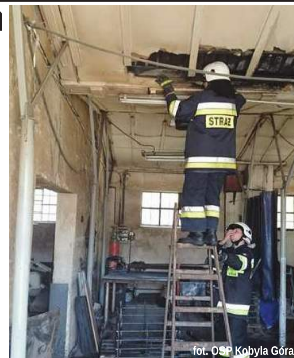
fol. OSP Kobyła Góra

Tego samego dnia, godzinę później – około 12.30, strażacy walczyli z pożarem rębaka w jednym z zakładów obróbki drewna w Czajkowie. Akcja gaśnicza trwała 1,5 godz. i zakończyła się powodzeniem. Przy-