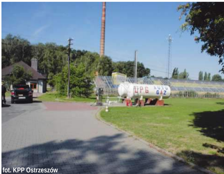
fol. KPP Ostrzeszów

Mundurowi zabezpieczyli około 12.000 litrów oleju opałowego, urządzenia oraz pojazdy służące