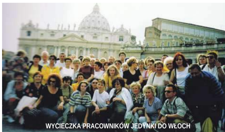
WYCIEZKA PRACOWNIKÓW JEDYŃKI DO WŁOCH

Lata 90. to również czas wyjątkowej pracy nad polepszeniem warunków nauki i pracy, m.in. wdrożony zostaje elektroniczny system obsługi biblioteki – MOL,