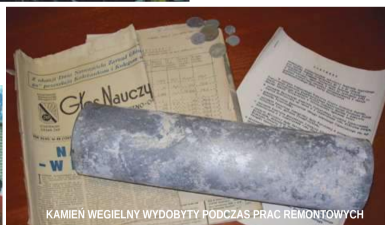
KAMIEŃ WEGIELNY WYDOBYTY PODCZAS PRAC REMONTOWYCH

Komitet Organizacyjny Obchodów 50-lecia Szkoły zwraca się do wszystkich, którzy dysponują pa-