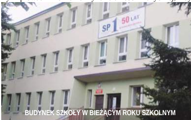
BUDYNEK SZKOŁY W BIEŻĄCYM ROKU SZKOLNYM