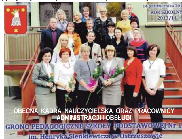
OBECNA KADRA NAUCZYCIELSKA ORAZ PRACOWNICY ADMINISTRACJI I OBSŁUGI GRONA PEDAGOGICZNE SZKOŁY PODSTAWOWEJ Nr 1 im. Henryka Sienkiewicza w Ostrzeszowie

Dziś przedstawiamy kolejnych pracowników, którzy podjęli pracę w Jedynce w ostatniej dekadzie, tj. w latach