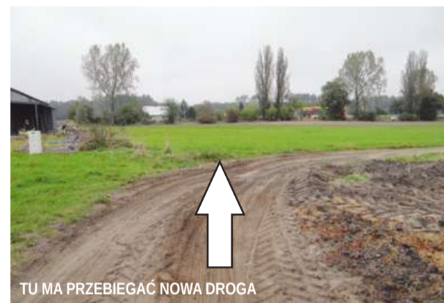
TU MA PRZEBIEGAĆ NOWA DROGA

Na razie nie wiadomo, jak problem z płynącą „nielegalnie” wodą zostanie rozstrzygnięty. Z naturą i prawami fizyki nie warto się zmagać. Natura i tak robi swoje. Decyzjami Samorządowego Kolegium Odwoławczego ani nawet sądowymi wyrokami chmurom nie można nakazać, aby deszcz z nich nie padał i woda też im nie ulegnie, bo już nie raz udowodni-