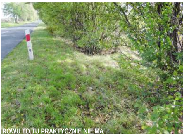
ROWU TO TU PRAKTYCZNIE NIE MA