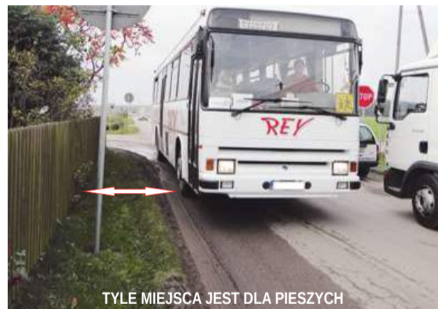
TYLKO MIEJSCA JEST DLA PIESZYCH

Tak się zdarzyło, że słyszałem, jak mieszkanka Biernac domagała się od Burmistrza Grabowa n/Prosną, aby wyznaczył przejście dla pieszych na drodze prowadzącej z Zamościa do Giżyc. Jak mówiła, samochody omijające Grabów, jadąc do Giżyc, sprawiają, że dzieci chodzące do szkoły w Zamościu są narażone na wielkie niebezpieczeństwo.