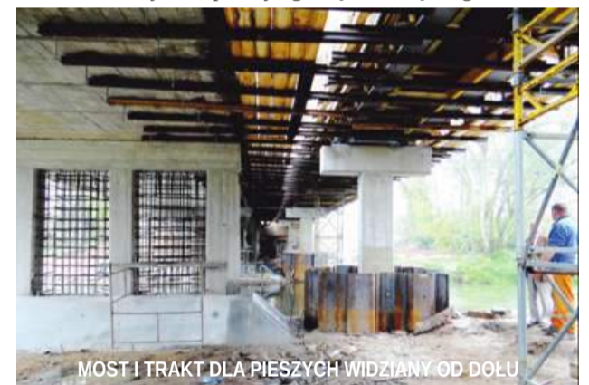
MOST I TRAKT DLA PIESZYCH WIDZIANY OD DOŁU

uprawnione, bo ludzie zazwyczaj patrzą na powierzchnię drogi i nie zastanawiają się nad tym, ile roboty trzeba wykonać na dole, aby móc położyć górną warstwę drogi.