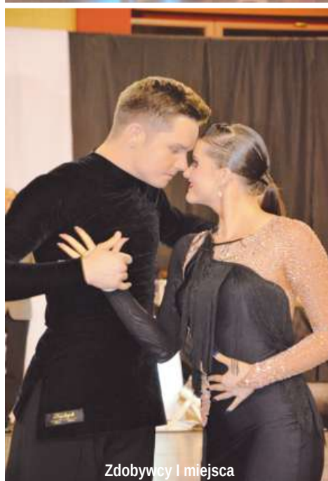
Zdobywcy I miejsca