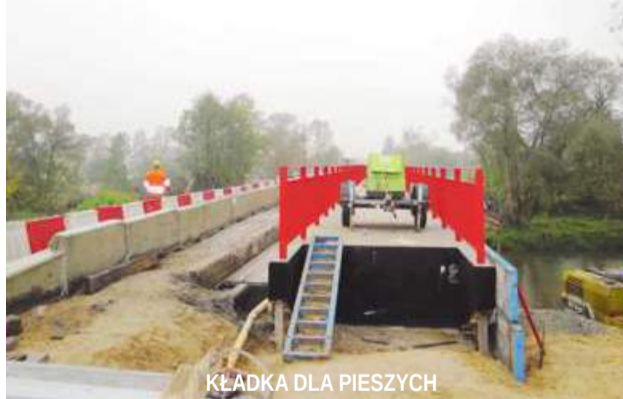
KLADKA DLA PIESZYCH

No cóż, nie da się zaprzeczyć, utrudnienia są, ale trwać przecież nie będą wiecznie. Termin zakończenia robót przewidziano na dzień 30.11.2014 r., zaś data ostatecznego rozliczenia wyznaczona została na dzień 15.12.2014. Jeśli aura nie spleta figla, termin zostanie dotrzymany - mówi burmistrz Zenon Cegła, zaznaczając, że wykonawca stara się, aby ustalonych dat dotrzymać. Za przekroczenie terminu grożą wysokie kary umowne. W najbliższych dniach, sporo przed wyznaczonym zakończeniem robót, do użytku oddana zostanie 2,5 m szerokości użytkowej kładka dla pieszych, więc przynajmniej oni wkrótce będą mogli bezpiecznie przekraczać Prosnę. Burmistrz i kierownik nadzorujący bu-