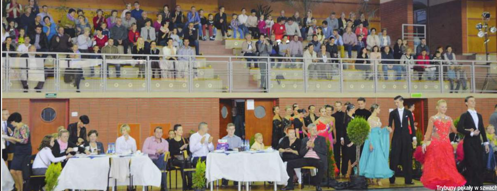
Trybuny pękały w szwach

W niedzielę przez prawie 9 godzin adepti tańca z całej Polski roztańczali jego magię przed publicznością w Kobyłej Górze.