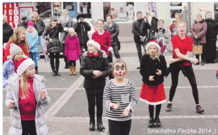
Szlachetna Paczka 2014

w relacje. Jako jednostki działamy dużo mniej, niż jako grupa. Szlachetna Paczka łączy z sobą mnóstwo ludzi - wolontariuszy, rodziny, darczyńców. Jeśli razem pocujemy odpowiedzialność za siebie, to wszystko się uda. I innej opcji po prostu być nie może. Pomóżmy wygrać w walce z biedą!