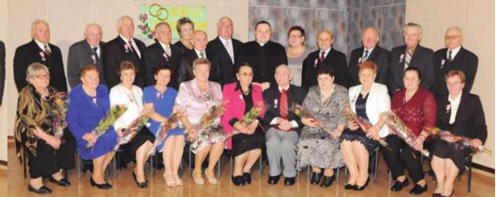
JUBILACI 50 LECIA ZAWARCIA ZWIĄZKU MAŁŻEŃSKIEGO ROK 2014

UROCZYSTOŚCI JUBILEUSZOWE W GMINIE DORUCHÓW