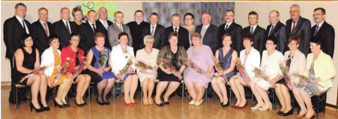
JUBILACI 30 I 35 LECIA ZAWARCIA ZWIĄZKU MAŁŻEŃSKIEGO ROK 2014

UROCZYSTOŚCI JUBILEUSZOWE W GMINIE DORUCHÓW