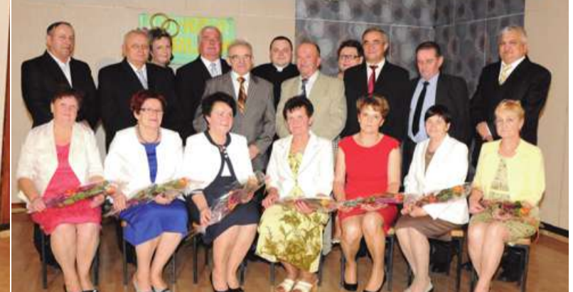
JUBILACI 40 I 45 LECIA ZAWARCIA ZWIĄZKU MAŁŻEŃSKIEGO

UROCZYSTOŚCI JUBILEUSZOWE W GMINIE DORUCHÓW