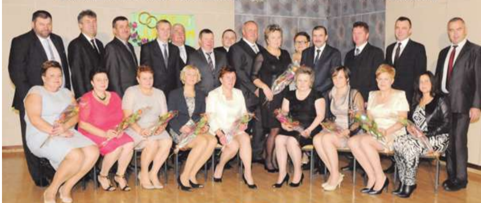
JUBILACI 25 LECIA ZAWARCIA ZWIĄZKU MAŁŻEŃSKIEGO ROK 2014

UROCZYSTOŚCI JUBILEUSZOWE W GMINIE DORUCHÓW