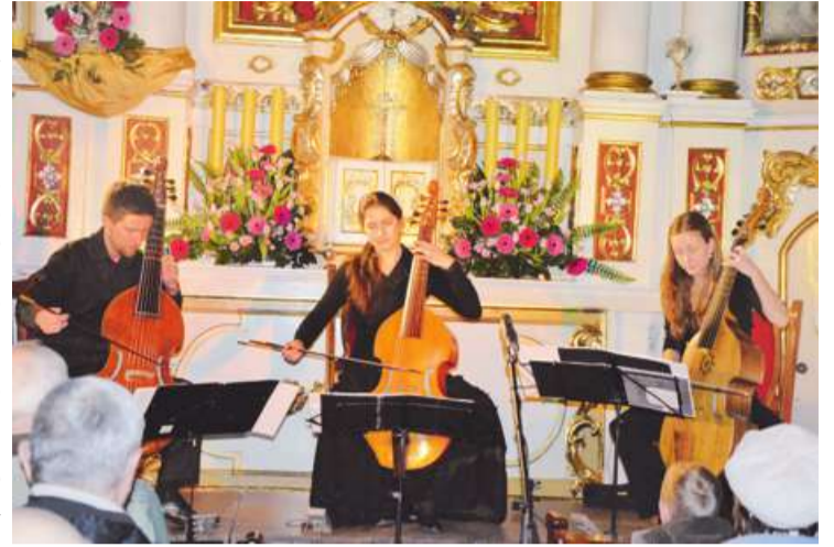
Koncert odbył się w ramach realizacji przez Dom Zakonny Zgromadzenia Sióstr Najświętszej Rodziny z Nazaretu Małego projektu dofinansowanego przez OLGD z osi IV Leader PROW na lata 2007-2013.

Zespół został, jak sami przyznali, przyjęty przez siostry nazaretanki po królewsku, za co serdecznie dziękowali. Publiczność z pewnością po raz kolejny wyszła zadowolona i usatysfakcjonowana wieczornym koncertem z cyklu „Perły w koronie”.