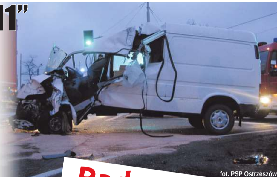
fol. PSP Ostrzeszów