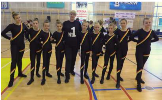
Klasyfikacja końcowa zawodów: