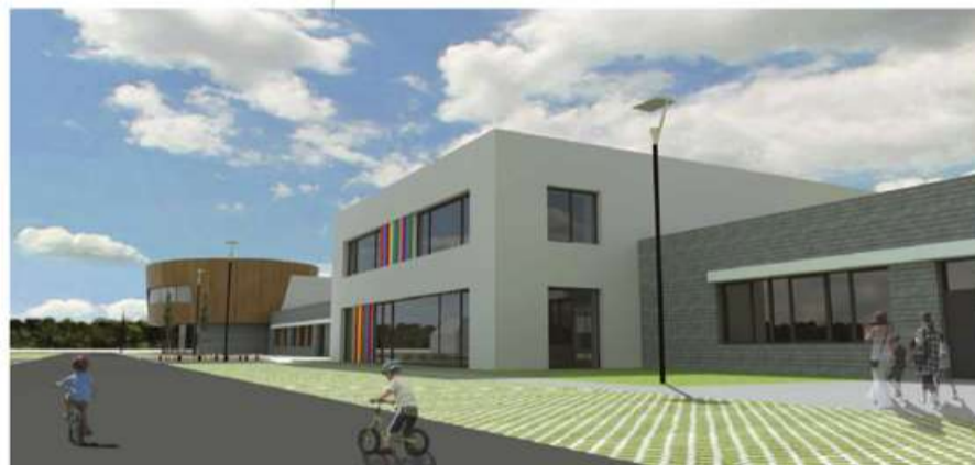
WIZUALIZACJA - WEJŚCIE DO SZKOŁY PODSTAWOWEJ (KLASY IV-VI)

Pierwszy, łączący przedszkole ze szkołą, wykorzystywany będzie jako węzeł żywieniowy wraz z pomieszczeniami technicznymi. W drugim łączącym szkołę z salą gimnastyczną będą pomieszczenia administracyjne. Uroku szkolnej bryle dodaje wyeksponowana na pierwszym planie budynek przedszkolnego rotunda auli przygotowanej na okolicznościowe uroczystości szkolne, oraz w różnorodny sposób zaprojektowane na całym budynku kolorowe międzyokienne pasy elewacji.