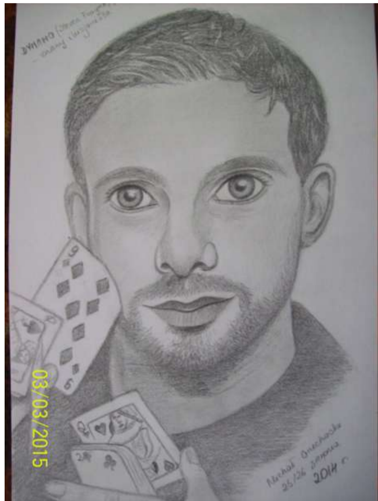
Steven Frayne - Dynamo

Mistrz kart. Potrafi czytać w myślach i chodzić po murach. Ma wielki dar wywoływania uśmiechów na twarzach i radości w sercach widzów. Jego rada: "Bez pasji i cierpliwości nie zajdziesz zbyt daleko".