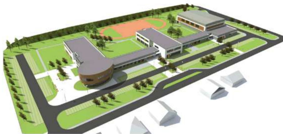
WIZUALIZACJA - WIDOK Z LOTU PTAKA

Wykonując wskazane przez radnych zadanie, przygotowano Regulamin Konkursu i powołano skład Sądu Konkursowego. Przedmiotem konkursu było opracowanie koncepcji architektoniczno-urbanistycznej Zespołu Szkolno-Przedszkolnego w skład którego wchodzi Szkoła Podstawowa i Przedszkole z dwoma częściami funkcyjnymi: