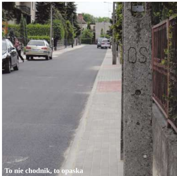
To nie chodnik, to opaska