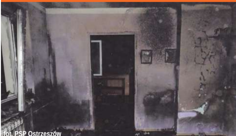
fol. PSP Ostrzeszów

Zwarcie w instalacji elektrycznej telewizora to zdaniem strażaków przyczyna pożaru domu w Chlewie (gm. Grabów nad Prosną). Ogień pojawił się 7 czerwca wieczorem.