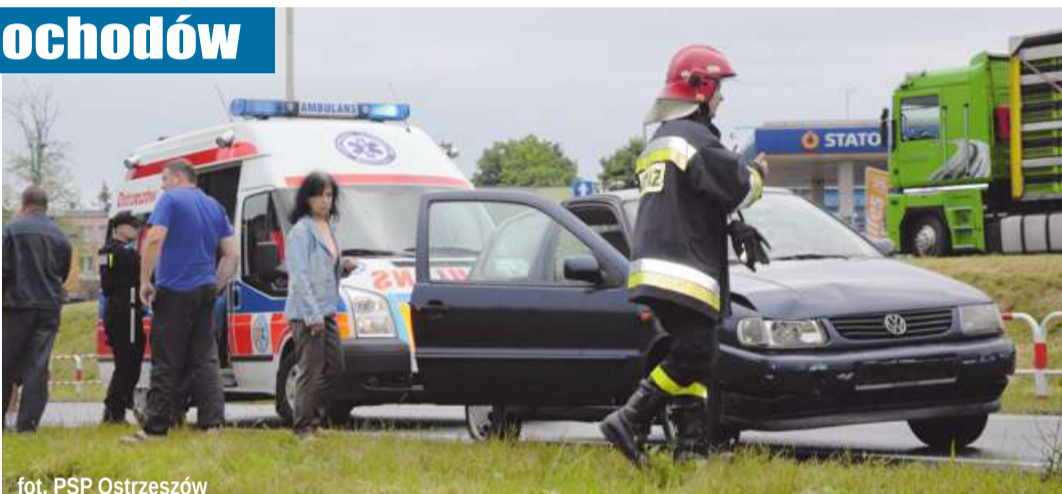
fol. PSP Ostrzeszów