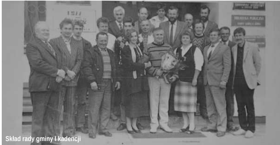
Skład rady gminy I kadencji

W tym roku obchodzimy 25. rocznicę bardzo ważnego wydarzenia, mianowicie przywrócenia w Polsce prawdziwego, oddolnego, prospołecznego samorządu terytorialnego, czyli możliwości realnego decydowania społeczeństwa lokalnego o własnym losie. Z tej okazji 28 maja, po VII Sesji Rady Gminy Kobyla Góra, odbyła się druga, uroczysta część sesji.