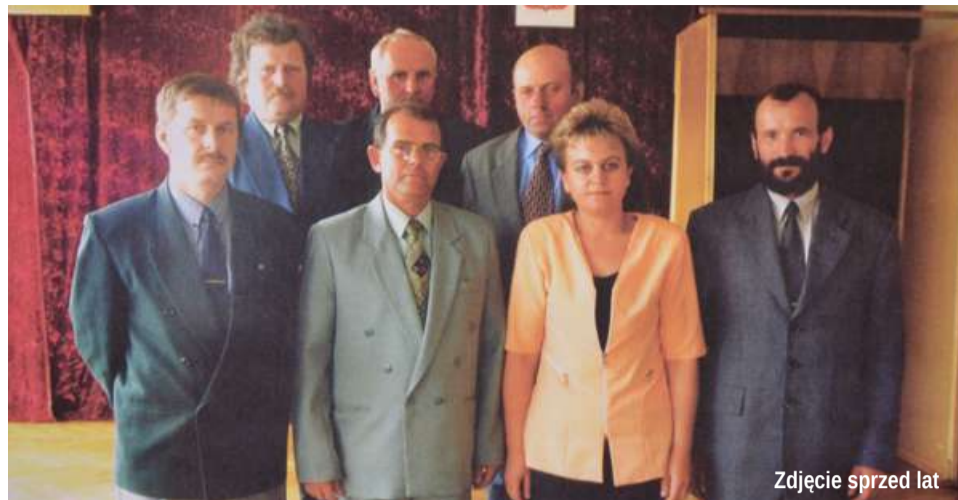
Zdjęcie sprzed lat