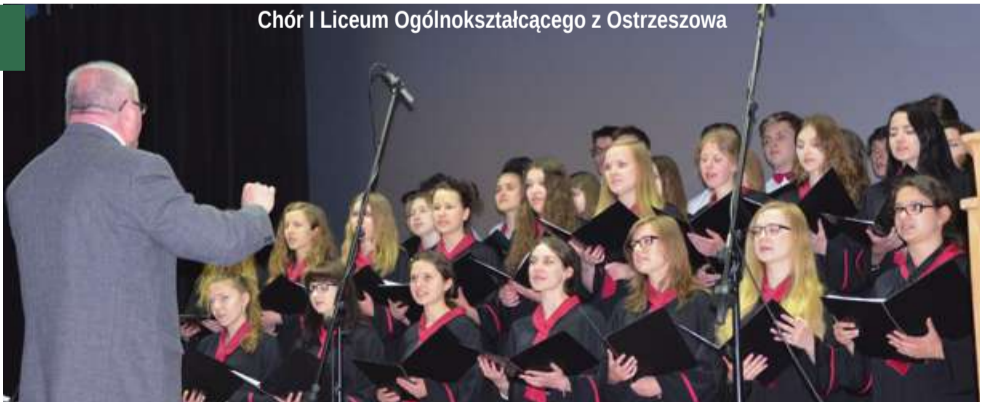
Chór I Liceum Ogólnokształcącego z Ostrzeszowa