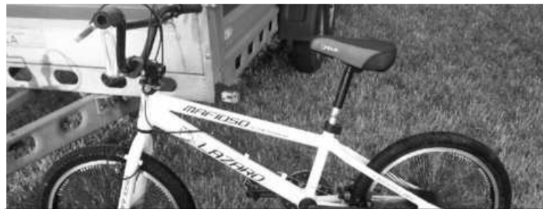
Sprzedam rower chłopięcy, cena: 300 zł, tel: 603 622 771

Wdowiec 72 lata poszukuje przyjaciółki do wspólnych wyjazdów i nie tylko, własne mieszkanie i samochód. Kontakt do uzyskania w redakcji.