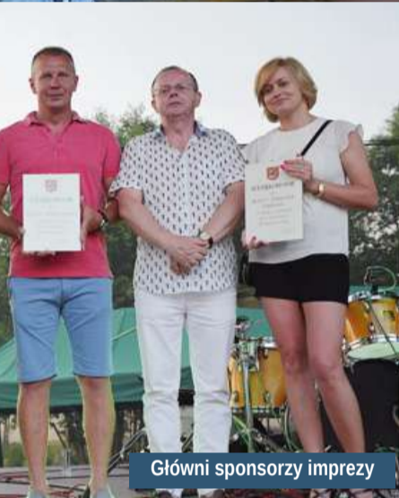
Główni sponsorzy imprezy