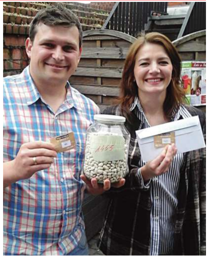
HP) wykorzystują to zjawisko do przewidywania sprzedaży przy pomocy rynków prognostycznych. Ale to już zupełnie inna historia.

No dobrze, tylko po co to wszystko? Powody były zasadniczo dwa: zabawa i chęć sprawdzenia doświadczenia Galtona. Oba założenia zostały osiągnięte. Eksperyment pokazuje, że ludzie o różnym doświadczeniu i pochodzeniu jako zbiorowość potrafią trafnie oszacować pewne wielkości mając ograniczoną liczbę informacji i pewne podstawowe doświadczenie. Niektóre koncerty (w tym m.in. Siemens, Google czy