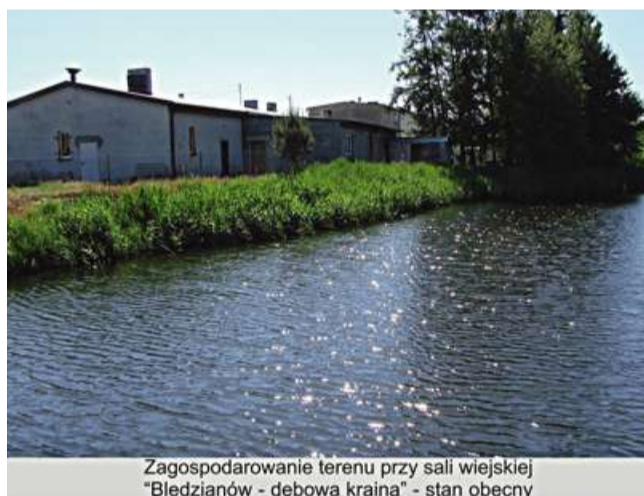
Zagospodarowanie terenu przy sali wiejskiej "Bledzianów - dębowa kraina" - stan obecny

W wyniku realizacji operacji zagospodarowany zostanie teren przy sali wiejskiej w Bledzianowie na cele rekreacyjne, społeczne i kulturalne. Zaplanowane do wykonania zadania to: ułożenie kostki brukowej przed obiektem, po jego prawej stronie w celu utworzenia chodnika prowadzącego na tyły budynku, oraz za obiektem sali wiejskiej, gdzie ustawiona zostanie również altanka, a także wykonanie nowego ogrodzenia, dzięki czemu powstanie zaciszne miejsce do organi-