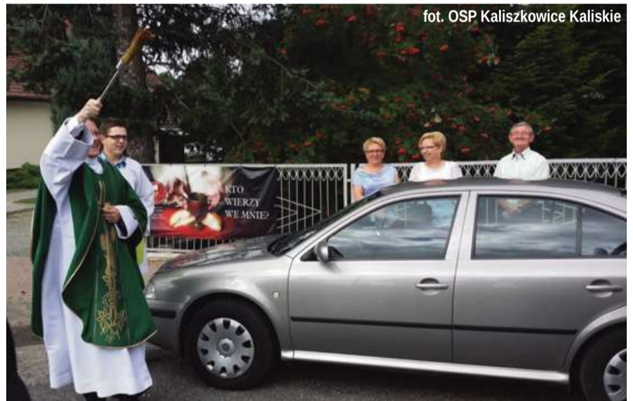
fol. OSP Kaliszkowice Kaliskie

W czasie poświęcenia zebrane zostały ofiary pieniężne, które zostaną przekazane na zakup środków transportu dla misjonarzy. Jak podaje organizacja MIVA Polska, zajmująca się pomocą w zakupie tych aut, w jej biurze na chwilę obecną znajduje się ponad 50 próśb od polskich misjonarzy i misjonek o pomoc w zakupie środków transportu. Najwięcej z nich, bo 30, pochodzi z Afryki, gdyż na tym kontynencie pracuje największa liczba misjonarzy z naszego kraju. Jest ich łącznie ponad 800. Najlicniejszą grupę stanowią posłani do Kamerunu (123). Najwięcej próśb dotyczy samochodów terenowych typu pick-up ze względu na stan dróg i konieczność przewozu osób, zaopatrzenia dla misji i prowadzonych dzieł, np. dla ośrodków pomocy medycznej i przychodni.