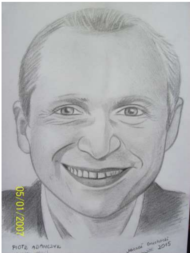
Piotr Adamczyk - ur. 21 marca 1972 r. w Warszawie. Jest jednym z najpopularniejszych i najbardziej docenianych polskich aktorów. W 2014 roku został uhonorowany srebrnym Medalem "Zasłużony Kulturze Gloria Artis".