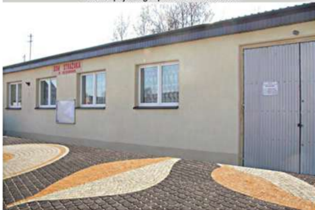
Zagospodarowanie terenu przy sali wiejskiej "Bledzianów - dębowa kraina" - koncepcja zagospodarowania terenu

W wyniku realizacji operacji zagospodarowany zostanie teren przy sali wiejskiej w Bledzianowie na cele rekreacyjne, społeczne i kulturalne. Zaplanowane do wykonania zadania to: ułożenie kostki brukowej przed obiektem, po jego prawej stronie w celu utworzenia chodnika prowadzącego na tyły budynku, oraz za obiektem sali wiejskiej, gdzie ustawiona zostanie również altanka, a także wykonanie nowego ogrodzenia, dzięki czemu powstanie zaciszne miejsce do organi-