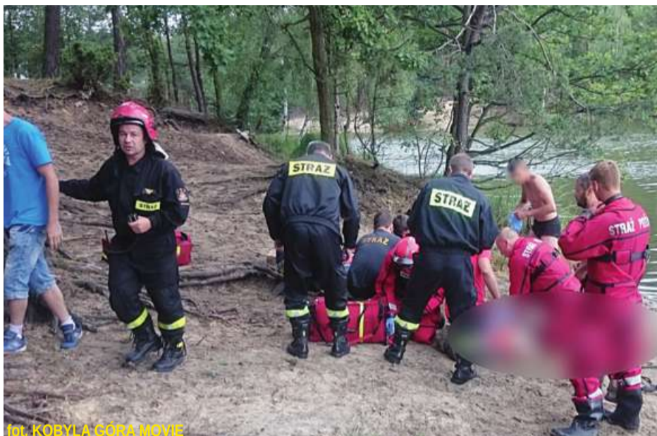
fol. KOBYLA-GÓRA MOVIE