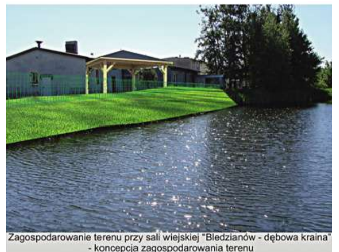
Zagospodarowanie terenu przy sali wiejskiej "Bledzianów - dębowa kraina" - koncepcja zagospodarowania terenu

zacji plenerowych przedsięwzięć integrujących mieszkańców Bledzianowa.