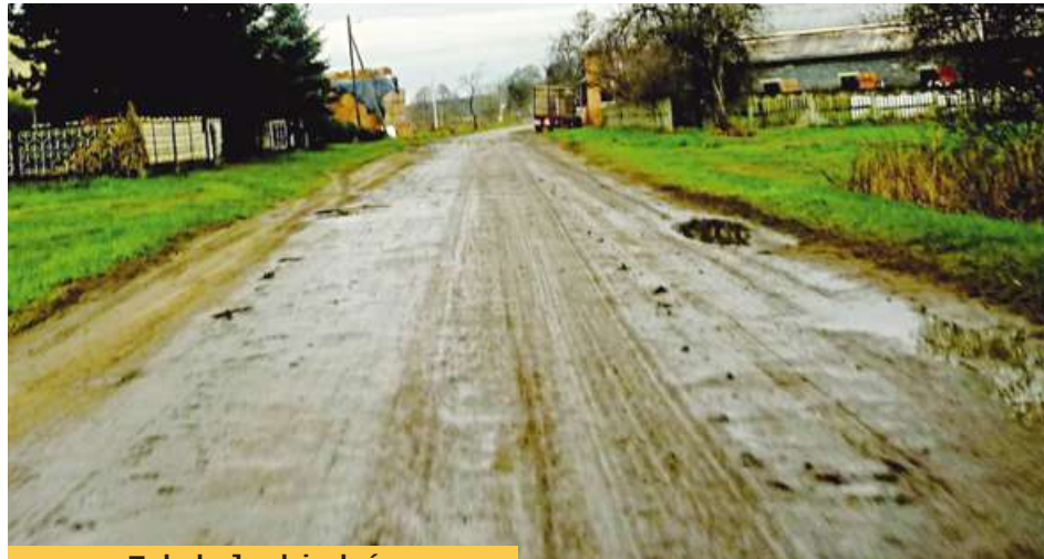
Tak było kiedyś.

głych do drogi wysłano pisma do kilku właścicieli nieruchomości, prosząc o utwardzenie zjazdów oraz oczyszczenie lub odkopanie zamulonego rowu. Wezwania do naprawy zjaz-