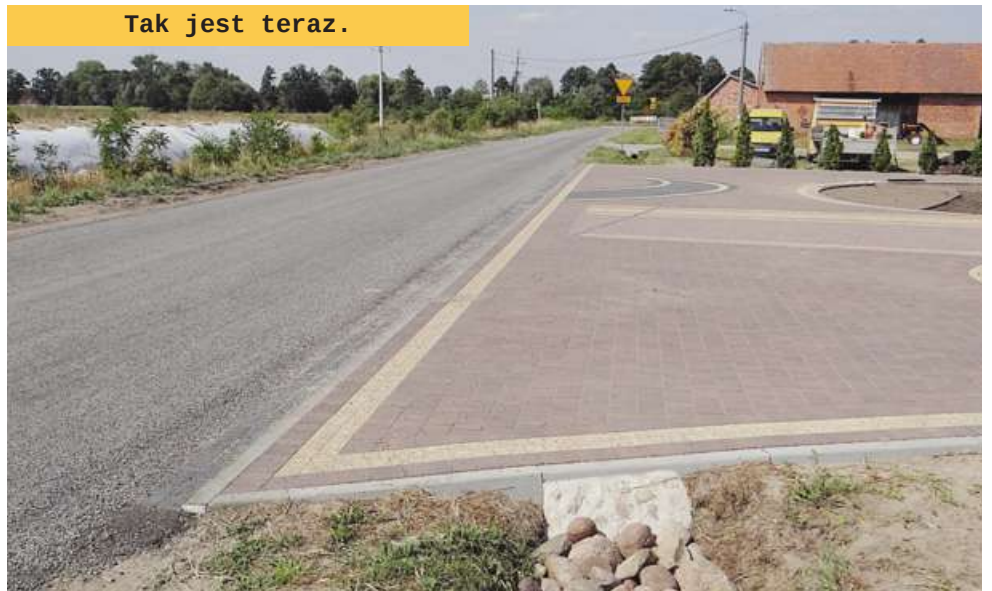
Tak jest teraz.

Właściciel obojętnie jakiej drogi sąsiaduje z wieloma innymi dysponentami nieruchomości i na tym polega międzyludzkie współdziałanie, aby wzajemnie sobie nie szkodzić, lecz pomagać. Gdyby rygorystycznie przestrzegać przepisy to powiat, jako właściciel drogi, najsamopierw powinien zażądać od właścicieli nieruchomości wzdłuż drogi zlokalizowanych, aby przedstawili pozwolenia na zjazdy do domostw i pól, z których korzystają. Mogłoby się wówczas okazać, że wiele zjazdów musiałoby być zlikwidowanych, bo niektórzy ludzie przed laty nie tylko tworzyli sobie zjazdy gdzie im pasowało, ale nawet pozasyypowali rowy i część pasów drogowych obsiewają lub zajmowali je na łąki i pastwiska dla bydła. Tak, niestety, dzieje się do dziś, szczególnie przy drogach niższych klas,