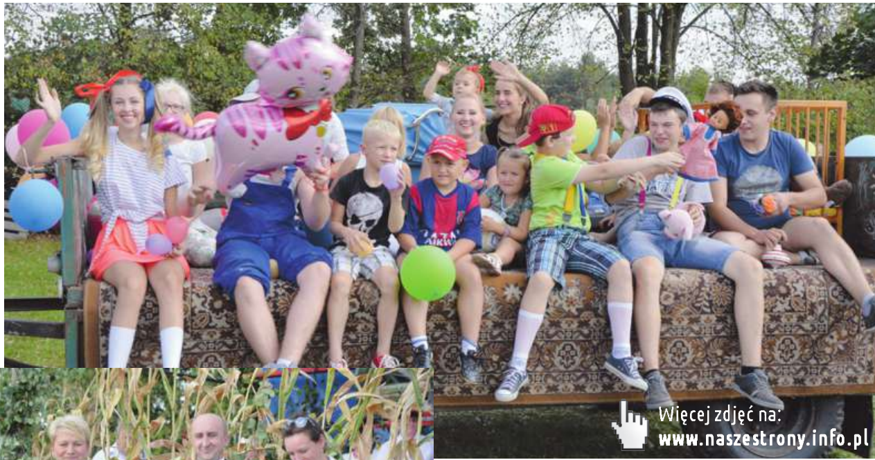
Więcej zdjęć na: www.naszestrony.info.pl