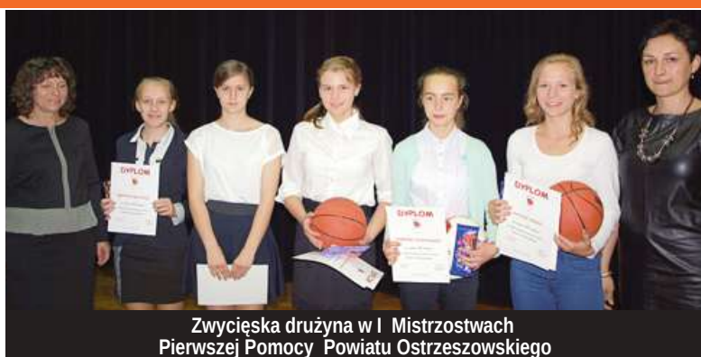
Zwycięska drużyna w I Mistrzostwach Pierwszej Pomocy Powiatu Ostrzeszowskiego

Jak co roku uczniowie naszej szkoły sprawdzali też swoje umie-