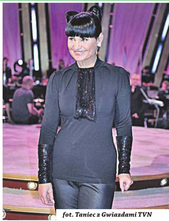
fol. Taniec z Gwiazdami TVN