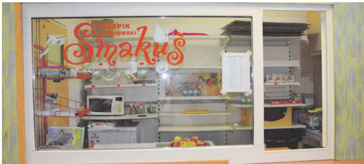
SZKOLNE SKLEPIKI ŚWIECĄ PUSTKAMI. INNE JUŻ ZOSTAŁY ZAMKNIĘTE.

Jeśli chodzi o sklepik szkolny, to świeci pustkami. Na regałach możemy zobaczyć tylko jabłka, kilka butelek wody, chipsy jabłkowe i przybory szkolne. Rozporządzenie zostało ogłoszone na kilka dni przed rozpoczęciem roku szkolnego, co dość