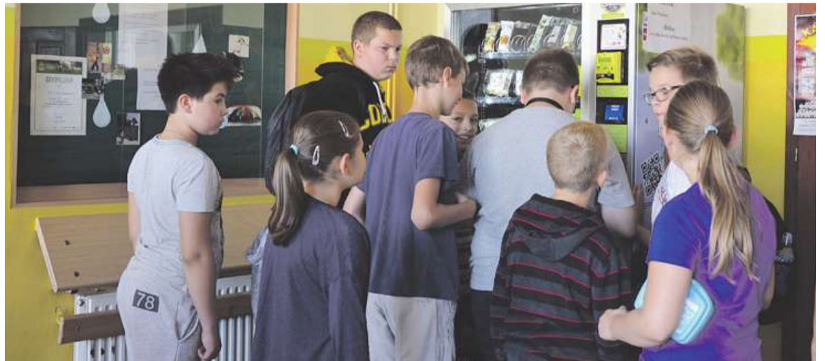
JEŚLI NIE MOŻNA ZDROWO ZE SKLEPIKU, TO MOŻNA ZDROWO Z AUTOMATU.