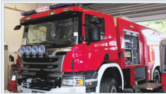
Ciężki samochód ratowniczo-gaśniczy GCB 9,5/40 na podwoziu SCANIA P410 6x6

Celem projektu jest wzmocnienie systemu bezpieczeństwa powiatu ostrzeszowskiego poprzez zakup ciężkiego samochodu ratowniczo-gaśniczego, którego zadaniem jest poprawa skuteczności działań polegających na ograniczeniu i likwidacji skutków katastrof naturalnych, pożarów, awarii technologicznych i innych zdarzeń oraz skróceniu czasu reakcji na zagrożenia. Zakupiony ciężki samochód ratowniczo-gaśniczy przyczyni się do wzrostu bezpieczeństwa obszaru powiatu ostrzeszowskiego m.in. terenów leśnych, rolnych oraz zakładów pracy, podniesie poziom bezpieczeństwa życia mieszkańców, będzie służył ratownikom podczas bezpośrednich działań ratowniczo-gaśniczych. Na zakup ciężkiego samochodu ratowniczo-gaśniczego Komenda Powiatowa Państwowej Straży Pożarnej w Ostrzeszowie poza środkami unijnymi otrzymała dofinansowanie z Powiatu Ostrzeszowskiego kwocie 174 372,00 zł.