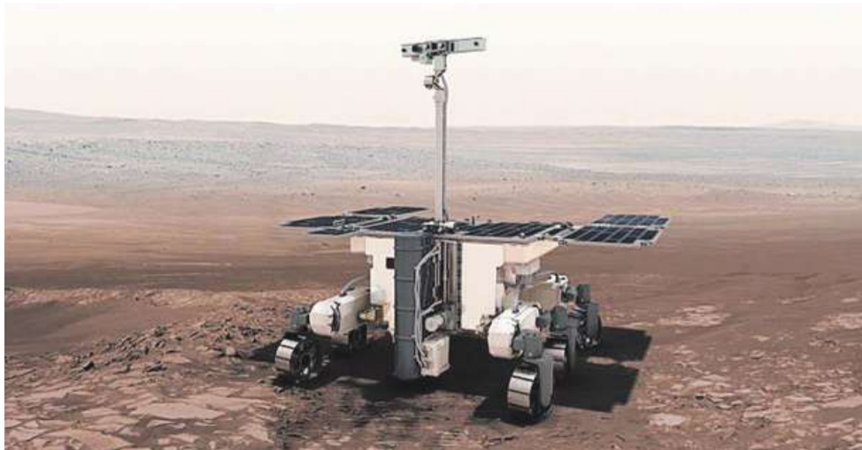
Komputerowa wizualizacja łazika misji ExoMars

Pod sztandarem ExoMarsa zrealizowane zostaną dwie duże misje, z których każda będzie składała się z dwóch urządzeń. Pierwsza para to orbiter -TGO i lądownik Schiaparelli – EDM o łącznej masie ok. 900 kg, które mają wystartować w marcu 2016 roku, natomiast drugi lot zaplanowany na 2018 rok przetransportuje na Marsa rosyjski lądownik oraz zbudowany przez Europejską Agencję Kosmiczną łazik (ExoMars Rover).