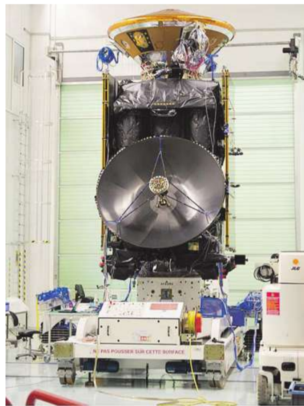
Zintegrowane w 2015 roku orbiter TGO oraz lądownik Schiaparelli

Orbiter TGO, zaprojektowany i skonstruowany przez Europejską Agencję Kosmiczną, został wyposażony w wiele instrumentów naukowych. Część z nich to urządzenia rosyjskie. Podczas swojej misji sonda będzie śledzić procesy zachodzące w atmosferze Marsa w poszukiwaniu śladów i dowodów na obecność gazów o potencjalnym znaczeniu biologicznym, takich jak metan i produkty jego rozpadu. Na Ziemi źródłem metanu najczęściej są procesy biologiczne, więc naturalnie nasuwa się podobne skojarzenie co do pochodzenia metanu na Marsie. Początek misji naukowo-obserwacyjnej planowany jest na połowę 2017 roku i ma ona potrwać co najmniej 5 lat.