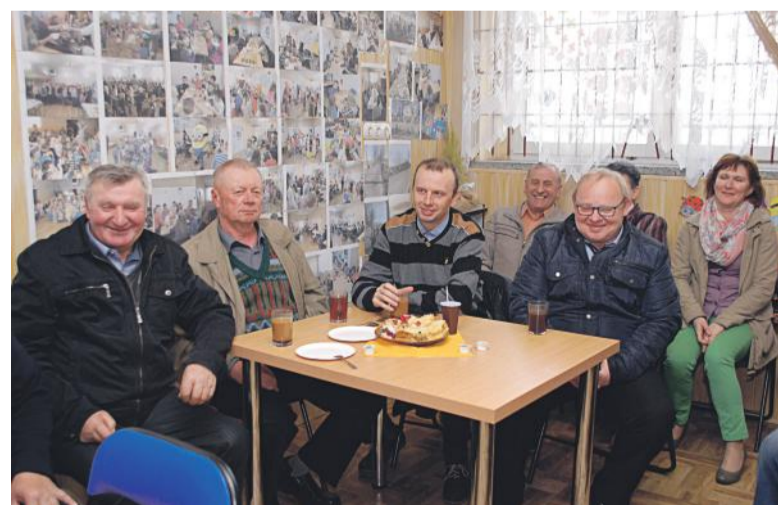
Stowarzyszenie integruje społeczność kilku wsi.