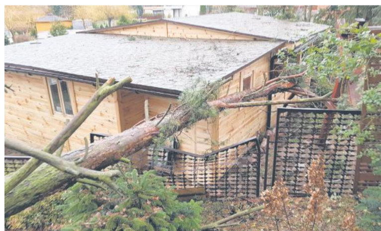
Drzewo przewrócone na domek letniskowy w Kobylej Górze.

Po pracowitej nocy, poranek i dzień był równie ciężkie. Tuż po godzinie 9, dwa zastępy strażaków ochotników z Kobylej Góry oraz Ostrzeszowa usuwały następstwa wichury przy ul. Marii Konopnickiej w Kobylej Górze. Tam z kolei dwa drzewa przewróciły się na domek letniskowy. Straty po tym zdarzeniu oszacowano na około 4 tysiące złotych.