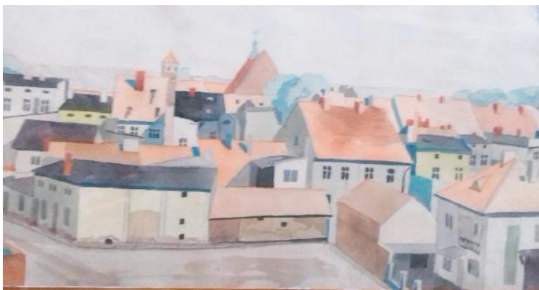
Ostrzeszów. Akwarela wykonana przez Janusza Kempę w roku 1960 z dachu Domu Kultury

O strzeszów - kazimierzowskie miasteczko, perła południowej Wielkopolski z licznymi zabytkami, bogatą kulturą i ciekawymi mieszkańcami urzeka każdego, kto w jakikolwiek sposób i przy okazji zajrzy do niego, lub się w nim „zakotwicz”. Mieszkańcy z „dziada pradziada”, ostrzeszowiaczy i ja - w tej liczbie - interesują się tym wyjątkowym miejscem na polskiej ziemi.