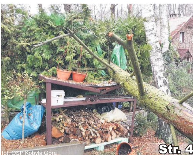
Str. 4