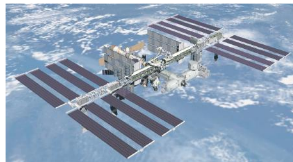
Międzynarodowa Stacja Kosmiczna ISS