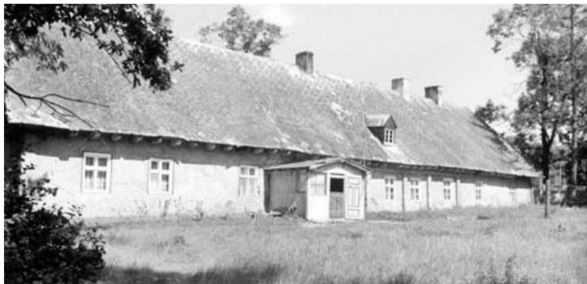
Dworek w Rojowie.