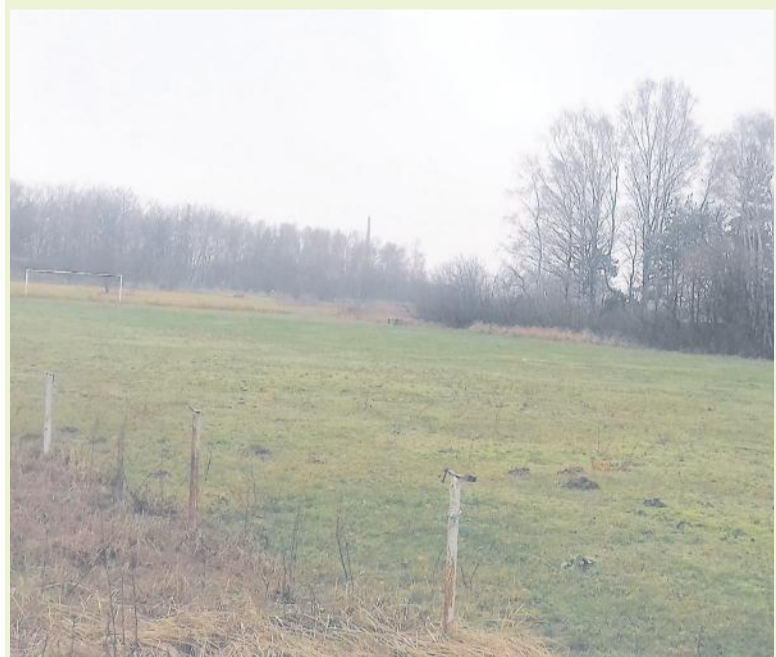
Miejsce w którym powstanie boisko.