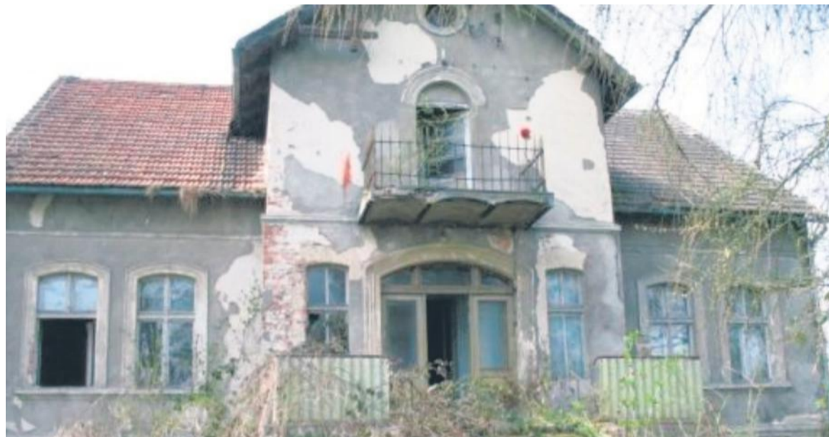
Ruiny Dworku w Rogaszycach.

w Polsce Mikołaj Wężyk, kaznodzieja dominikański, razem z królem Władysławem Jagiełłą i żoną jego królową Jadwigą wiele pracował przy nawróce-