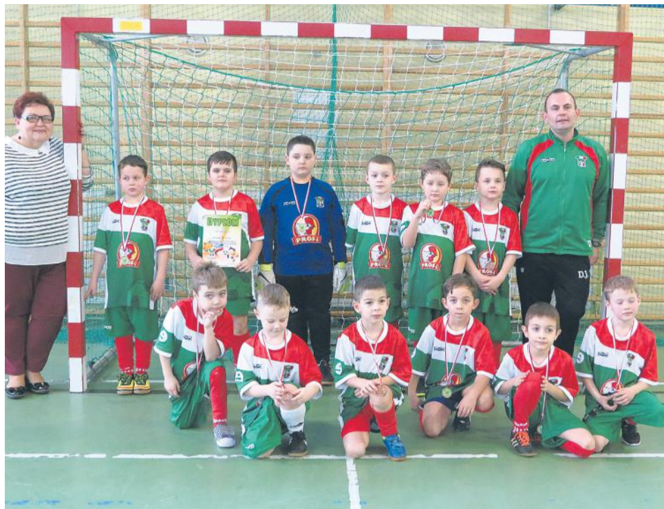
4. KB Doruchów