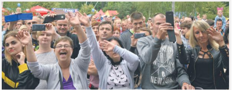
Tak bawił się Ostrzeszów na koncercie ANDRE .podczas ubiegłorocznych Dni Ziemi Ostrzeszowskiej. Czy w tym roku będzie podobnie?

będzie natomiast zapowiadany już wcześniej Adam Ostrowski, znany jako O.S.T.R. Ten występ ucieszy zapewne miłośników hip-hopowych brzmień. Mówi się, że artysta jest jednym z najbardziej znanych raperów w Polsce.