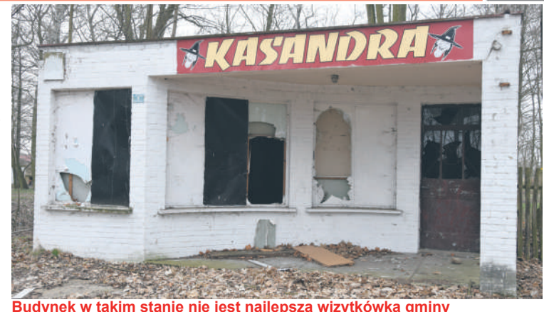
Budynek w takim stanie nie jest najlepszą wizytówką gminy

niemu w Polsce procesu kobiet posądzonych o czary. Tuż obok dawnego lokalu nadal istnieje piwnica, w której niegdyś rzekomo przetrzymywane były owe kobiety. Uzasadnionym więc byłby pomysł, aby upamiętnić to miejsce. Wykorzystanie do tego celu budynku starej restauracji zapewne pomogłoby stworzyć ciekawą atrakcję i promocję dla Doruchowa. Pojawiła się nawet koncepcja, by zrobić tam muzeum związane z historią czarownic.