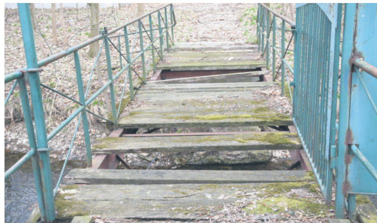
Jak widać - bez nakładów finansowych się nie obędzie

Budynek kilkakrotnie ogłoszony był do wynajmu, niestety chętnych nie było. - Na ostatniej sesji była mowa, że jest wiele propozycji do zagospodarowania. Natomiast ja nie znam tych