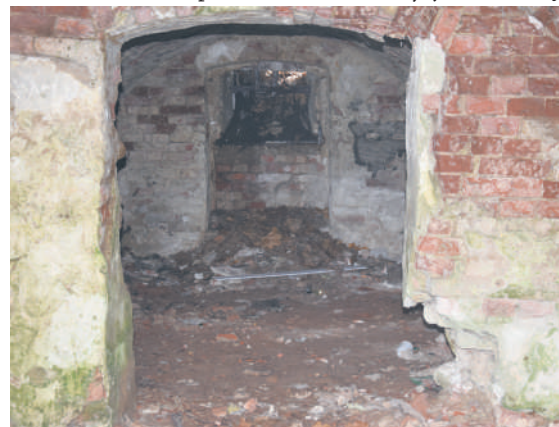
To właśnie w tej piwnicy przetrzymywane miały być kobiety posądzone o czary

Okazało się jednak, że sama koncepcja i projekt obiektu to dopiero początek góry lodowej. - Pomyślano wtedy, żeby zrekonstruować jakieś narzędzia tortur z tych czasów i tu jest największy problem, ponieważ to nie jest jakaś masowa produkcja. Trzeba by było to odtwarzać, a gmina nigdy taka bogata nie była, żeby narzekać na nadmiar środków finansowych. Czyli ten temat został odłożony w czasie – wspomina Mazur. Prawdopodobnie gdyby znalazły się środki, sprawa potoczyłaby się całkiem innym torem. Niestety, tych doruchowski urząd w nadmiarze nie posiada, a już na pewno nie na inwestycje w kulturę.